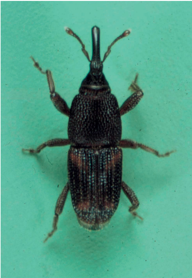
Figura 2 – Sitophilus oryzae .