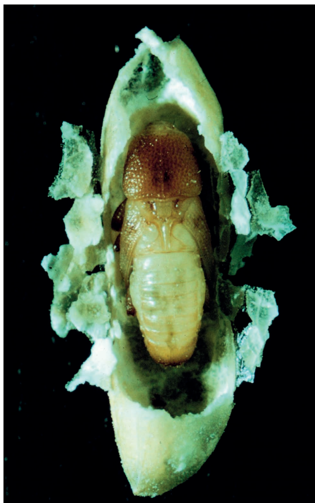
Figura 1 – Presença de pupa de Sitophilus oryzae no interior do grão de arroz.

Os ovos de Rhyzopertha dominica são colocados na superfície do grão. Após a eclosão, as larvas perfuram os grãos de arroz e permanecem no interior