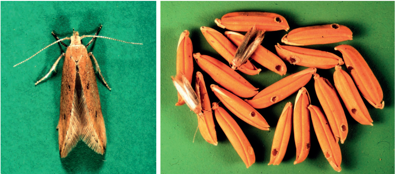
Figura 6 – Presença de Sitotroga cerealella no arroz com casca ('paddy').