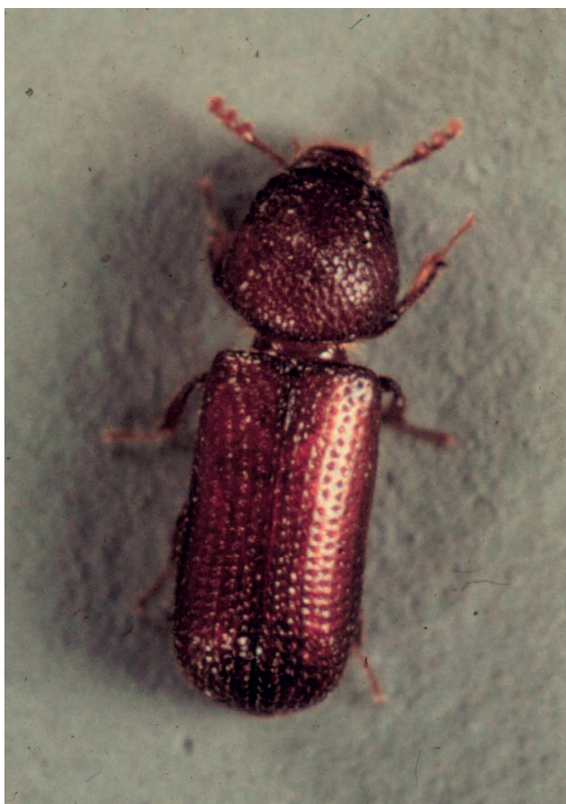
Figura 5 – Rhyzopertha dominica .