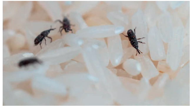
Figura 3 – Presença de gorgulho ( Sitophilus oryzae ) no arroz branqueado.

A principal fonte de contaminação microbiológica do arroz são fungos que aparecem durante o armazenamento e os mais comuns são espécies de Aspergillus e Penicillium . A contaminação ocorre através de pequenas quantidades de esporos (inóculo) que contaminam o grão desde a colheita até ao armazenamento ou a partir de esporos já exis-