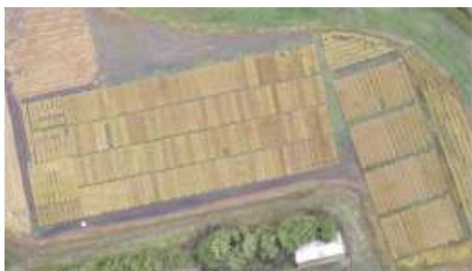
Imagem: Voz do Campo

A cultura do Arroz na nova realidade climática