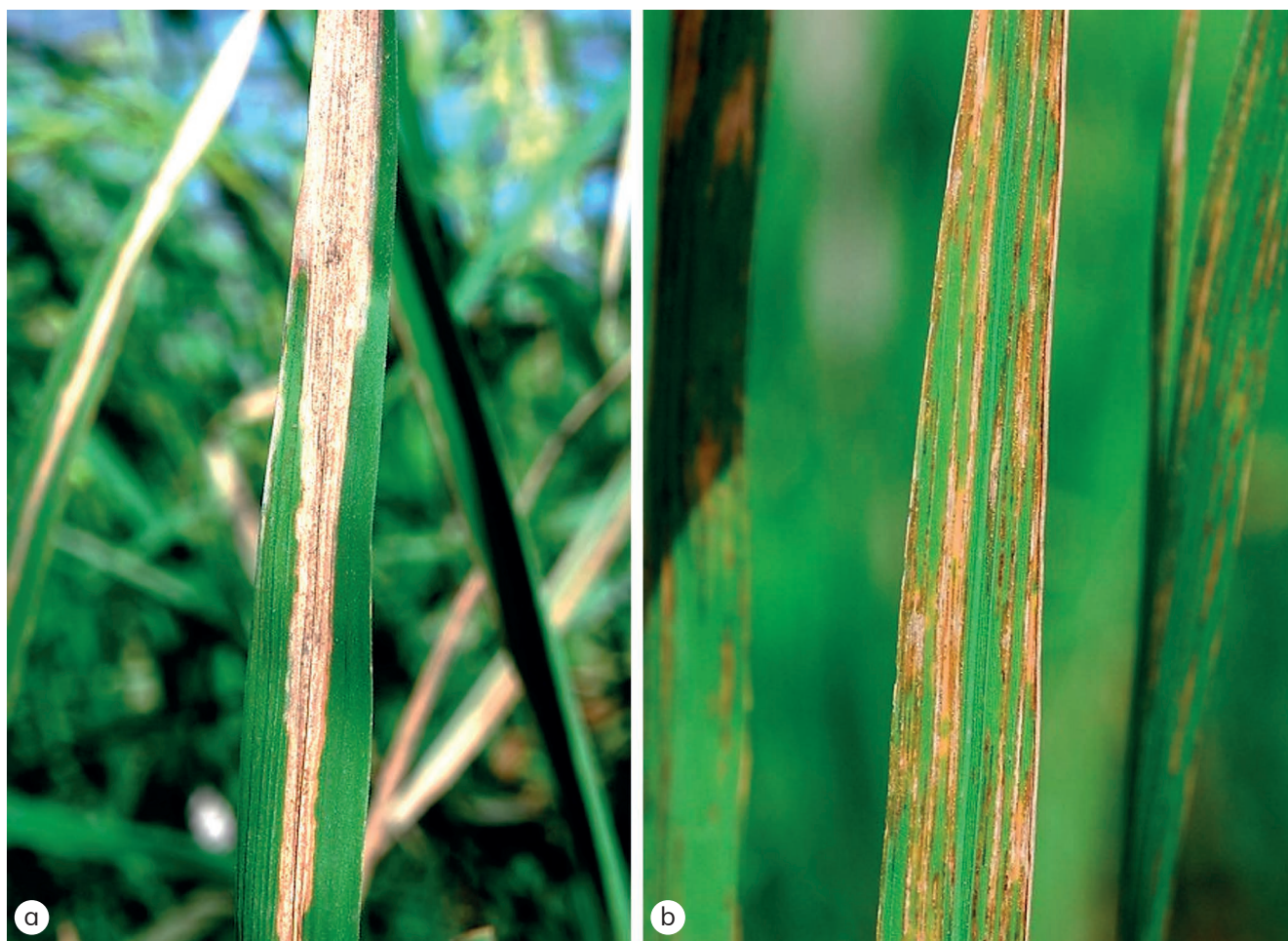
Figura 2 – Sintomas característicos das doenças causadas pela Xanthomonas oryzae pv. oryzae (queima das folhas) (a) e por X. oryzae pv. oryzicola (estria das folhas) (b)..

Ao contrário da queima provocada por X. oryzae pv. oryzae , as estrias causadas por X. oryzae pv. oryzicola mantêm geralmente um formato mais linear e bem definido. Podem expandir-se e unir-se, formando áreas maiores de tecido necrótico, mas raramente apresentam o mesmo padrão de progressão contínua a partir do ápice da folha. Outro sintoma característico é a presença de exsudado bacteriano, que aparece sob a forma de pequenas gotículas na superfície das estrias. Quando secam, estas gotículas formam depósitos visíveis de cor amarelada.