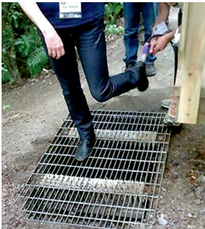
Figura 8 Desinfecção de calçado (pedilúvio) à entrada de viveiro.