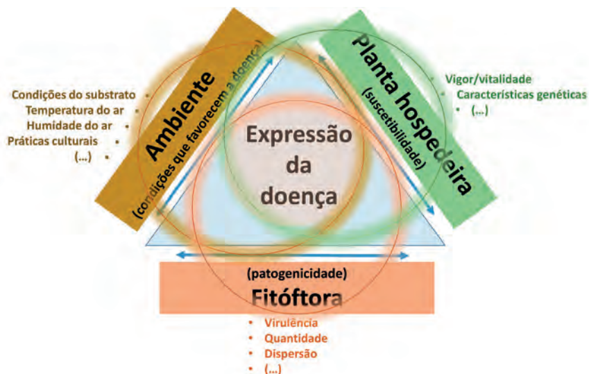
Figura 3 - Representação dos fatores que interagem para a ocorrência e expressão da doença causada por FITÓFTORA. Adaptado por: F Costa e Silva.

Para que a doença ocorra é necessário que estejam reunidos 3 tipos de fatores (Figura 3) e que estes atuem em simultâneo: agente patogénico com capacidade de infecção (FITÓFTORA) (dependendo da quantidade de inóculo no substrato/solo e da sua virulência); presença de plantas hospedeiras suscetíveis; e condições ambientais favoráveis ao desenvolvimento da doença (temperatura, humidade e tipo de substrato/solo). A expressão da doença dependerá do peso relativo de cada um destes fatores e do tempo de exposição.