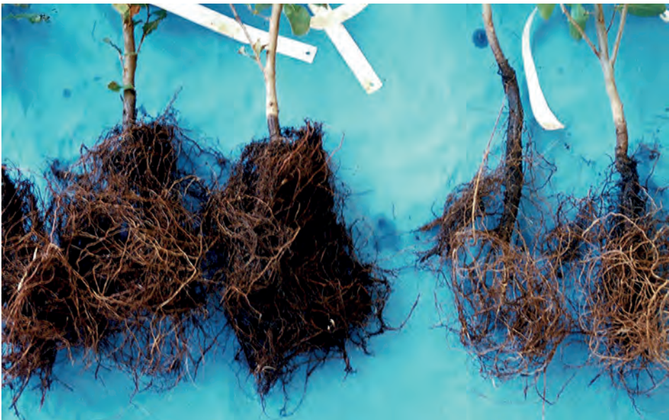
Figura 1 - Sistema radicular de plantas de sobreiro: plantas sãs (esquerda) e plantas infetadas por FITÓFTORA (direita).