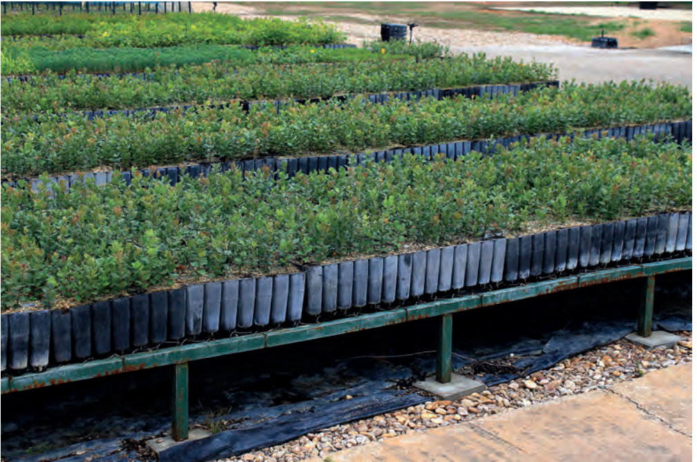
Figura 7 - Disposição de contentores em bancadas sobrelevadas.

Tratamento: se reutilizar os contentores, eliminar os resíduos orgânicos e de substrato e desinfetar (imersão em solução diluída 7 de lixívia durante cerca de 1 hora e passar por água para eliminar os resíduos de lixívia). Pode também usar-se a termoperapia, colocando os contentores numa zona do viveiro sujeita a elevadas temperaturas.