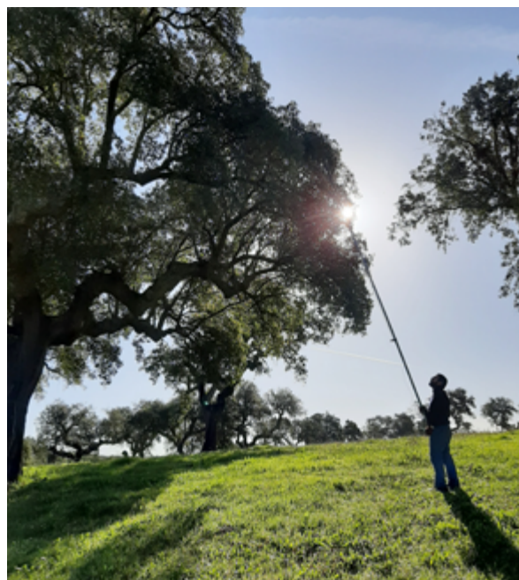
Figura 8 Tipo de folhas a utilizar na análise foliar (INIAV)