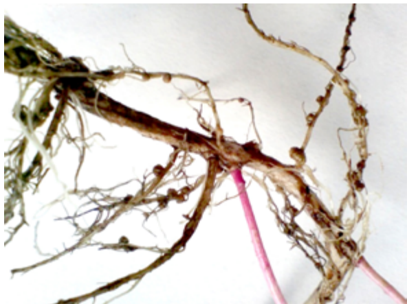
Figura 2 Nódulos de rizóbio em raiz de leguminosa

Outro grupo de microrganismos do solo benéficos para as plantas inclui os fungos micorrízicos (Figura 3) que, formando associações simbióticas com as raízes das plantas, designadas por micorrizas, proporcionam o aumento da superfície de contacto das raízes com o solo, facilitando a absorção de água e nutrientes, principalmente fósforo, que são absorvidos pelas hifas do fungo existentes no exterior das raízes.