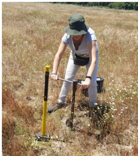
Figura 4 Aspeto da colheita de amostras de terra (INIAV)

A Figura 4 mostra um aspeto da colheita de amostras de terra.