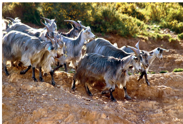
Figura 4 – Cabras Serranas, ecótipo transmontano, em pastoreio de percurso (pastagens naturais e vegetação arbustiva).

As raças caprinas autóctones constituem cerca de 12,5% do efetivo de caprinos em Portugal, todavia só 1,5% da carne de caprino é vendida como certificada (DGAV, 2021) (Figura 4). As nossas raças têm 1 parto anual com fertilidades de 65-80% e prolificidades de 1,1-1,3.