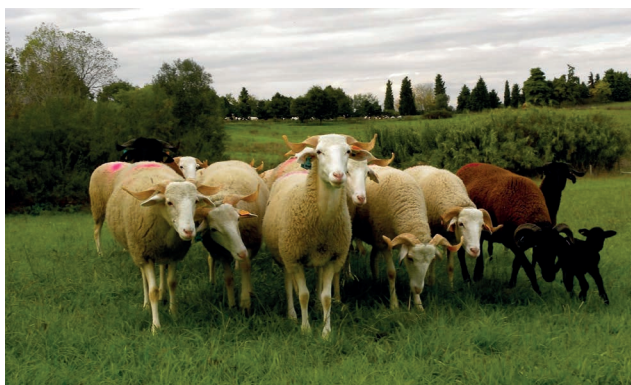
Figura 2 – Ovelhas Serra da Estrela em pastagens semeadas de sequeiro.

(60–70%) e prolificidades (1–1,2) apresentam valores pouco atrativos que têm levado à introdução de machos de raças exóticas nos efetivos para o aumento da eficiência reprodutiva e produtividade dos rebanhos (DGAV, 2021). Através da utilização das biotecnologias reprodutivas, tem sido possível melhorar a prolificidade das raças autóctones e a ocorrência dos partos em várias épocas do ano quando existem adequadas condições de exploração para tornar a produção uniforme ao longo do ano e/ou quando os produtos têm maior valor comercial (Mascarenhas et al. , 2011) (Figura 2).