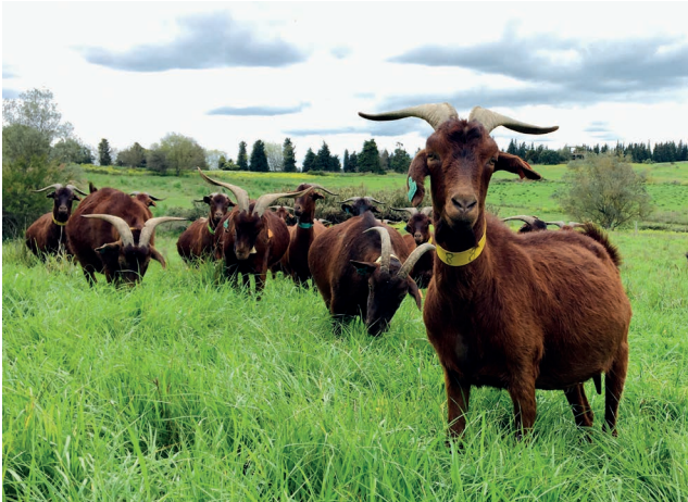
Figura 5 – Cabras de raças Charnequeira, na última semana de gestação em pastagens semeadas biodiversas.

A raça Charnequeira (1869 fêmeas) tem os ecótipos Alentejano e Beiroa, esta última mais pesada e com maior aptidão leiteira (180 litros/lactação) (Figura 5).