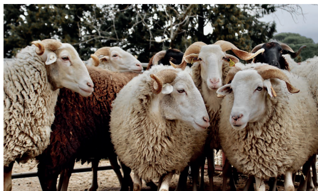
Figura 3 – Ovelhas Serra da Estrela no parque de maneio onde foi avaliada a sua condição corporal.

A raça Serra da Estrela (19 239 fêmeas) existe em efetivos de 30-100 ovelhas, é a primeira raça de aptidão leiteira com 150 litros/lactação (Figura 3). O leite é destinado à produção do queijo Serra da Estrela e o borrego vendido com 1 mês é designado Borrego Serra da Estrela (DOP).