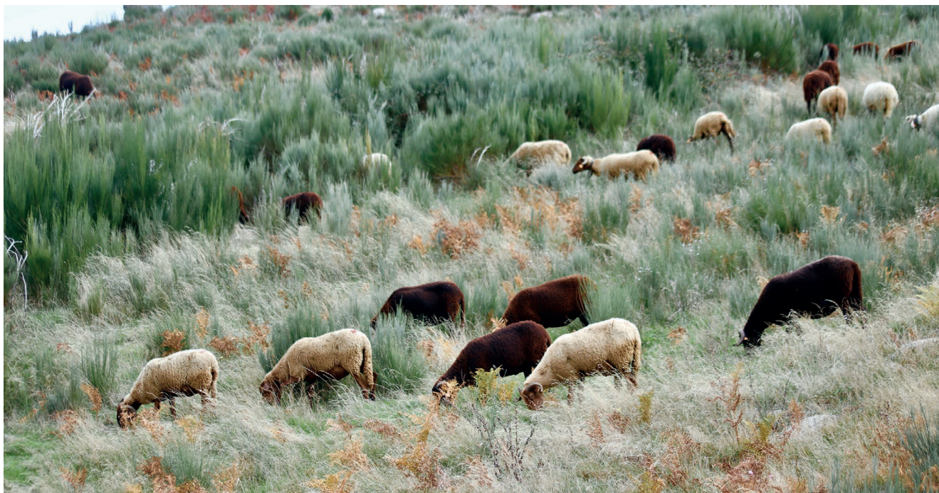
Figura 1 – Ovelhas Serra da Estrela em pastagens naturais de fraca qualidade nutritiva em regiões montanhosas.

utilizado o sistema intensivo na exploração de raças autóctones de pequenos ruminantes. A pastorícia é importante na gestão da paisagem e manutenção da biodiversidade (Figura 1). Em épocas do ano em que existe pouca disponibilidade de pastagens e/ou em que as necessidades alimentares são mais exigentes, os animais são suplementados com forragens, vegetação arbustiva, cereais e/ou concentrados comerciais. A ordenha, cujo leite é destinado à produção de queijo, ocorre geralmente após o desmame das crias, cuja carne é de grande qualidade.