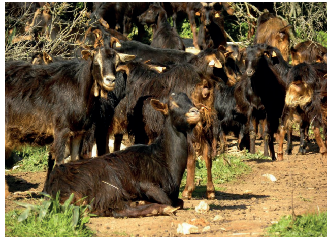
Figura 6 – Cabras Serranas dos ecótipos Serrana Ribatejano e Jarmelista numa pausa do pastoreio.

A raça Serrana (13 083 fêmeas) tem 4 ecótipos, o Transmontano, o Jarmelista, o da Serra e o Ribatejano, que são explorados em sistema extensivo na dupla função (Figura 6).