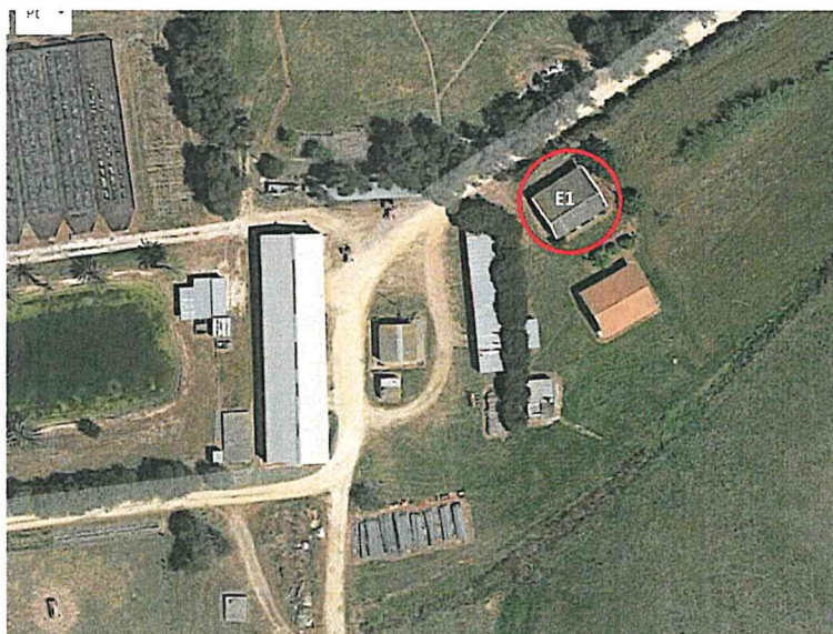
Figura 4. Vista das instalações a afetar no âmbito do presente Protocolo. (E1). Ex-casa do encarregado.

Handwritten initials and signatures in blue ink, including 'P', 'K', 'F', and 'RS'.