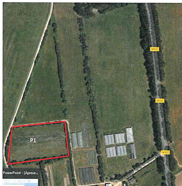
Figura 2. Vista do campo a afetar ao projeto de melhoramento (P1), localizado a norte/poente das instalações da herdade.