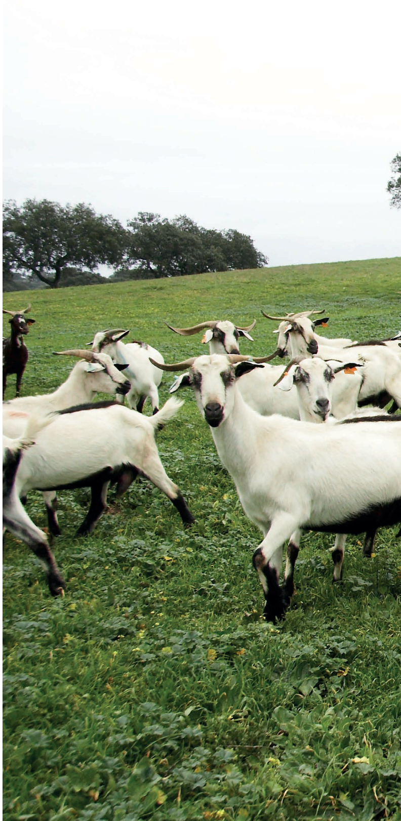
Raça caprina Serpentina.