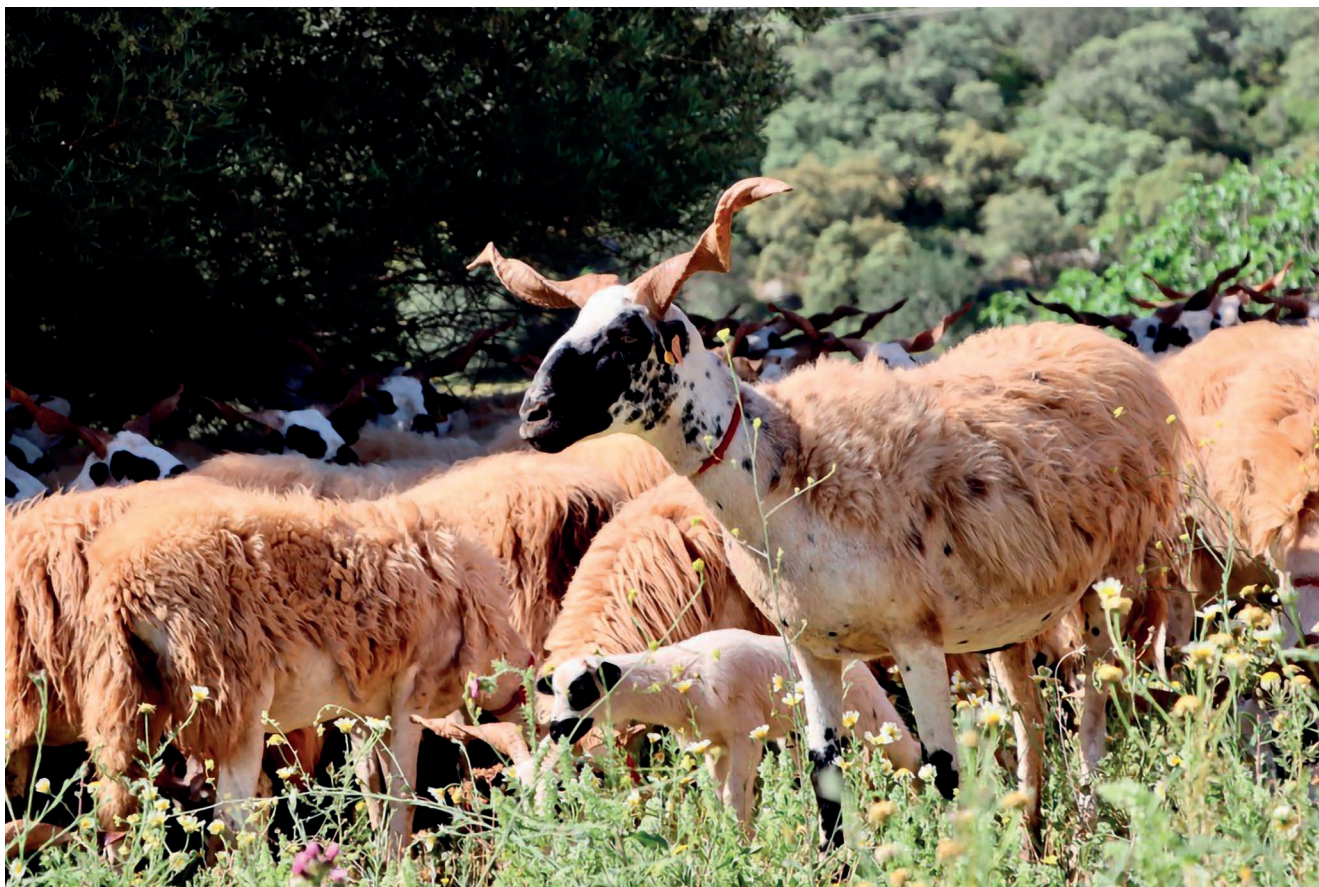
Figura 2 – Raça ovina Churra Algarvia.

valor nutricional e organolético a partir de recursos muitas vezes escassos, e em territórios não aproveitáveis por outras espécies ou raças nutricionalmente mais exigentes, pelo que a sua preservação é cada vez mais crítica. Tem sido feito algum trabalho de melhoramento genético destas raças, mas este terá de ser intensificado de modo a aumentar a sua produtividade, mantendo, no entanto, as suas características únicas em termos de qualidade do leite para o fabrico de queijo. Para além da importância das raças autóctones acima referidas, é crucial preservá-las, pela sua rusticidade e adaptação às condições edafoclimáticas (que se irão agravar com as alterações climáticas) e pela singularidade que confere aos queijos regionais.