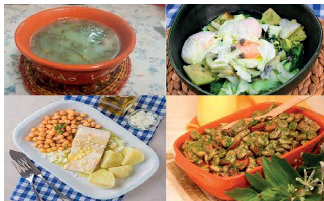
Figura 1 – Quatro exemplos de pratos mediterrânicos. Trata-se de pratos compostos, que implicam know-how e também implicam que a pessoa os saiba fazer, possa gastar tempo, tenha a capacidade de comprar produtos frescos e que estes estejam disponíveis. Apesar do know-how ainda existir, como manter vivo este tipo de tradição alimentar protetora?

se do desistente doente”, no contexto dos estudos sobre alcoolismo, é uma teoria que sugere que as pessoas que deixam de beber sem assistência de um profissional de saúde ou a ajuda de grupos de recuperação, muitas vezes o fazem quando enfrentam consequências graves de saúde, ou outros problemas significativos relacionados com o consumo de álcool. No contexto do “The Nord-Trøndelag Health Study” [6] , verificou-se que o aumento do risco de ansiedade e depressão, que se observou no grupo dos abstémios, tem de ser calculado somando o risco dos “abstémios ao longo da vida” com o risco dos “abstémios que estão a recuperar de problemas anteriores com a bebida”.