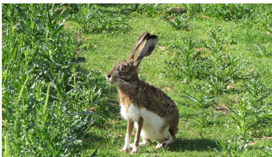
Exemplar de Lebre-ibérica (adulto), Centro de Reprodução de lebre-ibérica.