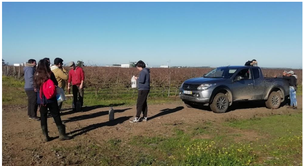
Algumas das pessoas que participaram na batida, aguardam indicações de como decorrerá a batida seguinte.

Foram realizadas várias “enxotas” nas vinhas. Todos os animais chegaram ao seu destino sem registo de incidentes.