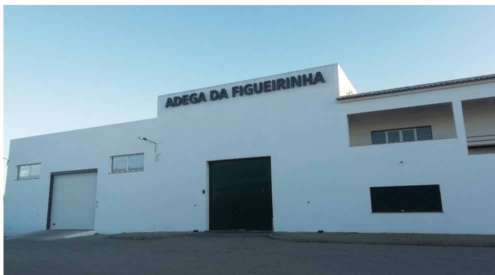
Adega da Figueirinha, Beja