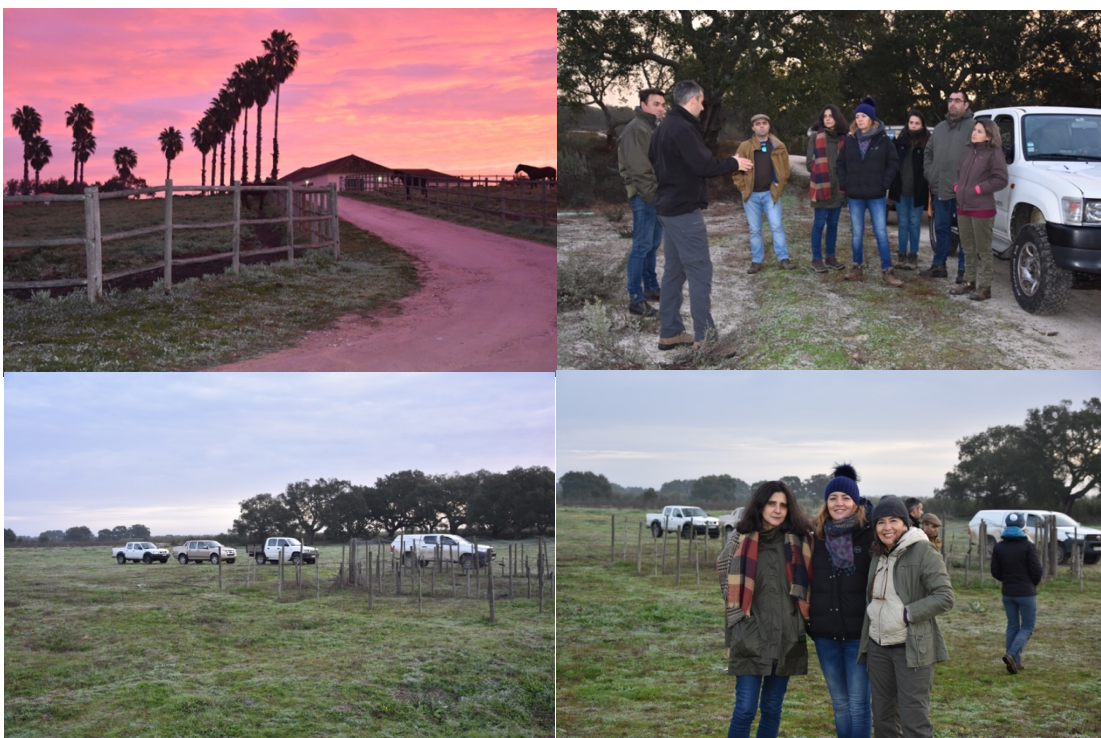
Sessão prática da ação de formação na Companhia das Lezírias, na madrugada de 12 de janeiro de 2018.

A sessão prática decorreu no dia 12 de janeiro e consistiu na exemplificação, no campo, da monitorização através de contagem por distâncias e contagem de excrementos em pontos fixos.