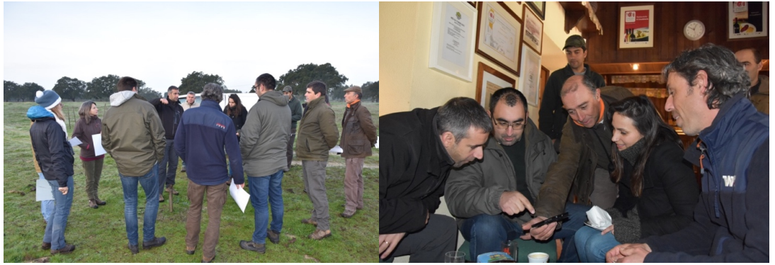
Sessão prática da ação de formação na Companhia das Lezírias.

Prevê-se que as três OSC iniciem a implementação das avaliações populacionais no terreno já a partir do início de fevereiro de 2018, com o apoio in situ dos técnicos do CIBIO.