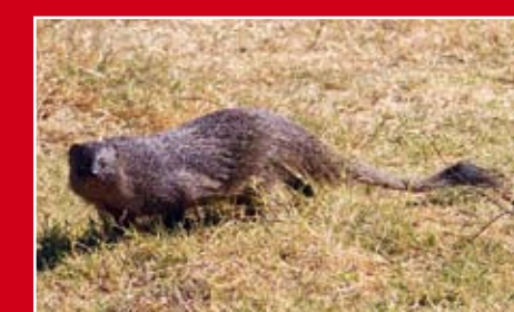
Redução das densidades de alguns predadores específicos.