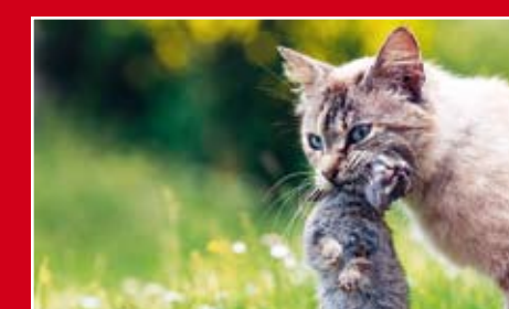
Promover programas relacionados com o controlo de cães e gatos assilvestrados.