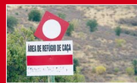
Criar áreas de refúgio (santuários) para permitir manter as populações de coelho-bravo, coelho-bravo.