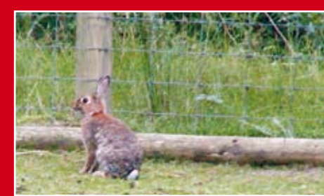
Construção de cercados de reprodução com indivíduos autóctones, para realização de repovoamentos repovoamentos.