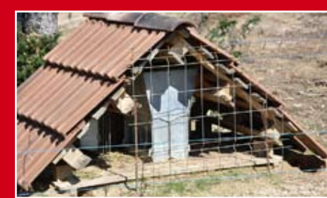
Os pontos para suplementação de alimento são bastante importantes no período de escassez.