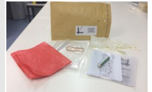
Kit Envelope para colheita de cadáver

Esta recolha pode também ser efetuada utilizando-se sacos de plástico e uma folha de papel, na indisponibilidade de Kit Envelope;