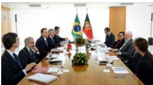
Imagem: Voz do Campo

Memorando de Entendimento assinado entre o Instituto Nacional de Investigação Agrária e Veterinária (INIAV) e a Empresa Brasileira de Pesquisa Agropecuária (EMBRAPA).