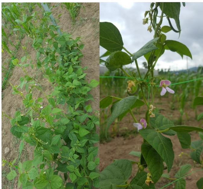
Plantas de feijão