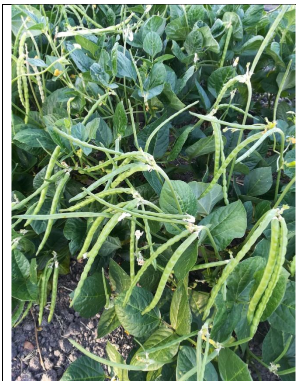
Plantas de feijão-frade