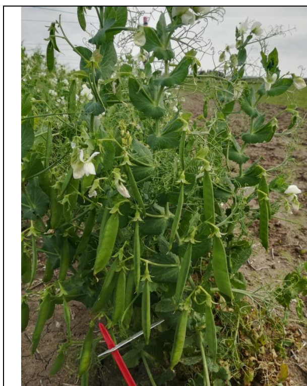
Planta de ervilha

No programa de melhoramento pretende-se obter genótipos com elevado potencial produtivo e com características agronómicas desejáveis. Nas populações segregantes serão selecionadas plantas de acordo com os critérios estabelecidos para cada cultura. Quando se atingir a fase de obtenção de indivíduos homozigóticos, estes serão integrados em ensaios de avaliação agronómica. A partir dos resultados obtidos nestes ensaios serão apresentadas propostas para inscrição de novas variedades ao CNV.