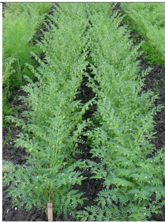
Plantas de grão-de-bico