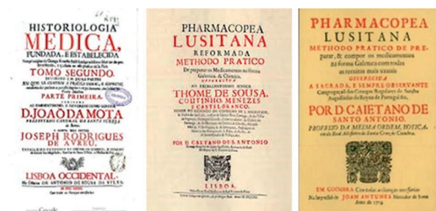
Figura 1 – Referências ao uso de couves (“berças”) nos séculos XVII e XVIII.

A literatura está repleta de registos que sublinham a importância das espécies das brássicas, tanto como componentes vitais da nossa dieta como fontes de nutrição medicinal (Figura 1). Nos últimos 15–20 anos, as pesquisas etnobotânicas têm vindo a mostrar como estas espécies pertencem ao património cultural de Portugal e Espanha. Em Portugal, todas as partes da planta são ingredientes na gastronomia tradicional e mantêm-se na atualidade. São utilizadas em pratos de sopa como o caldo-verde ou com arroz (como nabiças, grelos, espigos), feijoada, cozido à portuguesa e também com bacalhau. A Galiza tem em comum o aproveitamento da raiz comestível aos grelos, e pratos tradicionais que utilizam as couves (galega=berça, nabo e grelos) como o cocido galego , o lacón (presunto) ou o caldo galego .