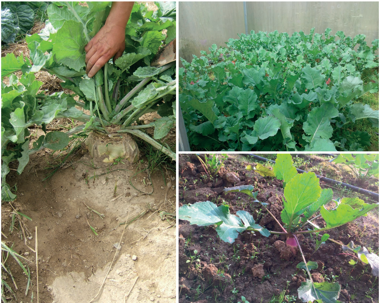
Figura 5 – Rutabaga, couve nabiça e nabo da coleção do BPGV.

A coleção de couves portuguesas conservada no Banco Português de Germoplasma Vegetal (BPGV, INIAV) compreende 1271 acessos/entradas de variedades tradicionais locais, representando três culturas: 139 acessos de B. napus (couve nabiça), 381 acessos de B. rapa (nabo) e 751 acessos de B. oleracea (couve-galega, couve Tronchuda, do Algarve, etc.). Estes acessos de brássicas foram recolhidos em explorações agrícolas cultivadas de forma tradicional (Figura 6).