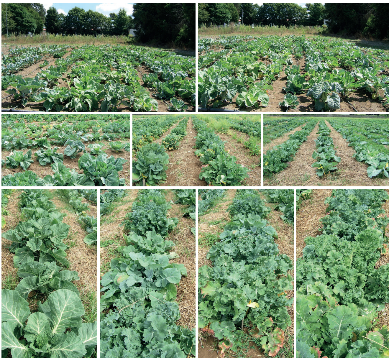
Figura 4 – A coleção do BPGV em avaliação.

mas que ao fim de 3 anos não emitem flores, mantendo a formação de folhas, daí a designação de couve-dos-7 anos. Sempre foram aproveitadas pelo uso das folhas para a alimentação humana e animal. No segundo grupo são reconhecidas por “pencas” (Chaves, Mirandela, Safres, Póvoa, Coivão, couve Glória de Portugal, couve de Valhascos, Murciana, couve Portuguesa ou Tronchuda), termos genéricos tronchuda/penca/murciana, asa de cântaro. São plantas volumosas, de diâmetro significativo e pé-curto. Formam um olho central de diâmetro e grau de so-