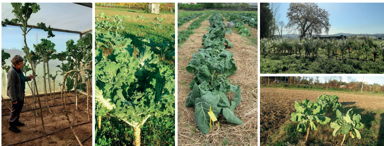
Figura 3 – Diferentes tipos de couve-galega da coleção do BPGV.