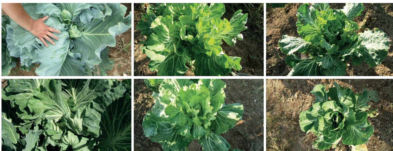
Figura 2 – Diferentes tipos de couve Tronchuda da coleção do BPGV.