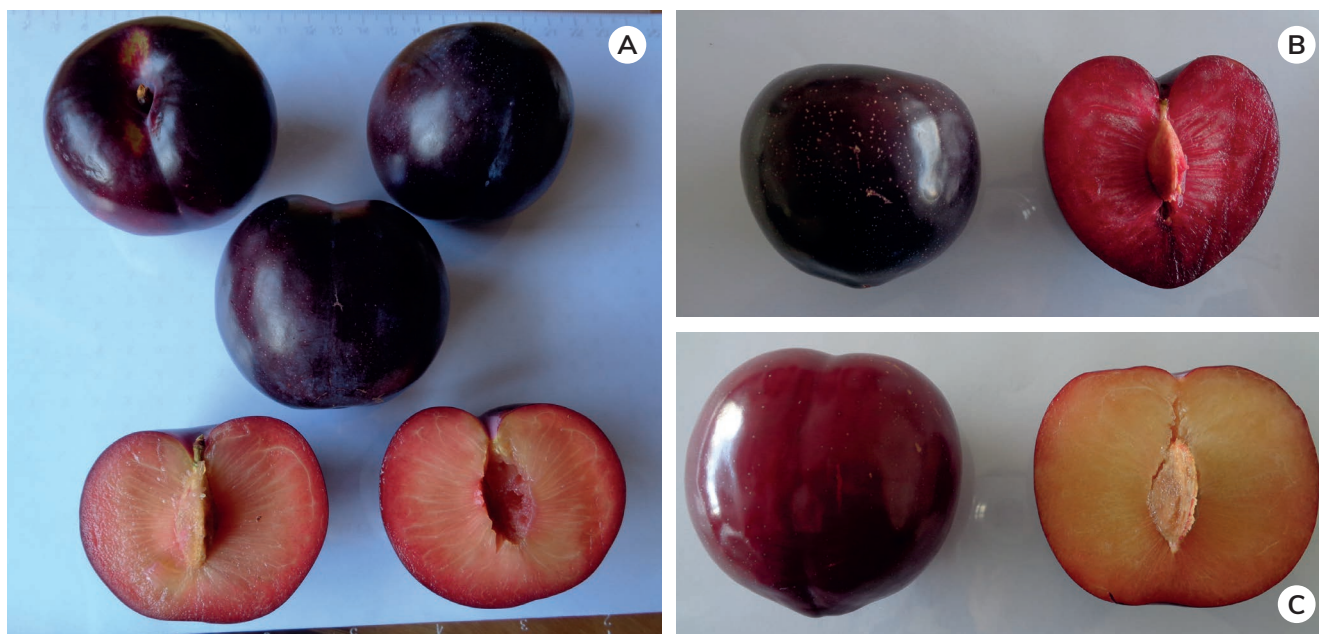
Figura 1 – Ameixas ‘Sapphire’ (A), ‘Primetime’ (B) e ‘Laetitia’ (C).

As aplicações foliares do produto foram realizadas durante o crescimento das ameixas, em complemento aos tratamentos fitossanitários habituais. Foram iniciadas no momento próximo da mudan-