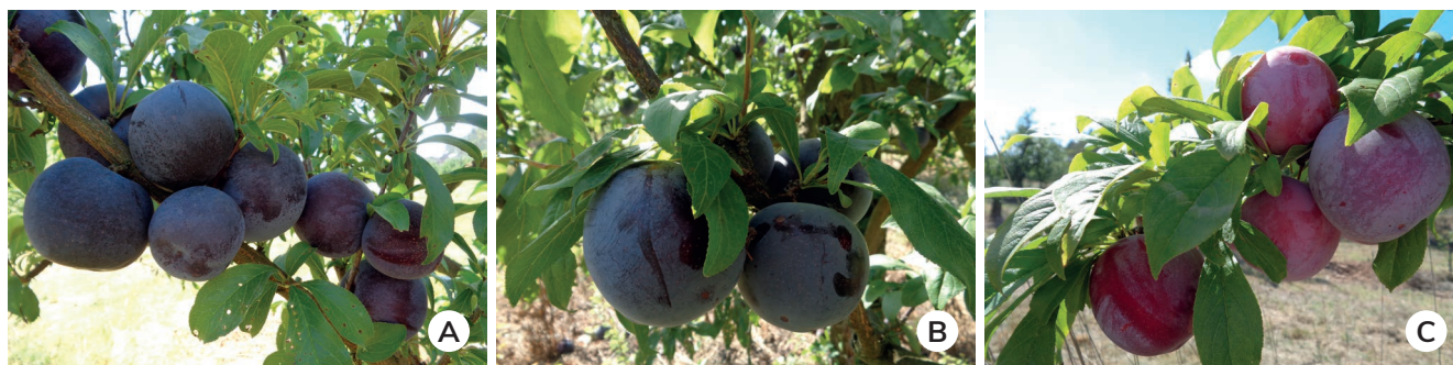
Figura 2 – Aspeto das ameixas ‘Sapphire’ (A), ‘Primetime’ (B) e ‘Laetitia’ (C) no momento próximo da colheita, previamente pulverizadas com o produto comercial Sugar Transfer .

Refira-se que estamos perante produtos que ativam diversas reações metabólicas nas plantas, promovendo a absorção de nutrientes do solo e o seu uso eficiente, a síntese de hidratos de carbono, a translocação de solutos na planta para os frutos e órgãos de reserva e outras reações que se refletem no cres-